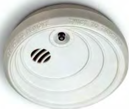
Det ska finnas minst en uppsatt och fungerande brandvarnare i varje lägenhet. Billigare liv- och egendomsförsäkring är svårt att hitta.

brandvarnare installeras, men att de boende sedan själva ansvarar för att regelbundet prova att den fungerar och byta batterier vid behov.