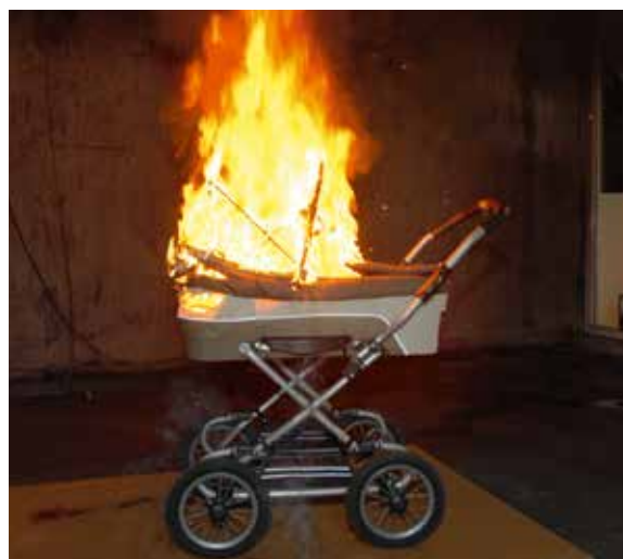
Håll trapphuset fritt från brännbart material och sådant som är i vägen vid en utrymning.

uthyrningen är det lämpligt att den som hyr ut lokalen för en dialog med hyresgästen om hur brandskyddet är tänkt att fungera när det gäller utrymningsvägar, tillåtet antal personer, eventuella larm med mera. I vissa fall kan det också vara lämpligt att tillsammans gå igenom lokalen/lokalerna innan de tas i bruk för arrangemanget. Det bör också finnas någon form av skriftlig brandskyddsinformation och checklista till hyresgästen. Sådana bör också vara uppsatta i lokalen.