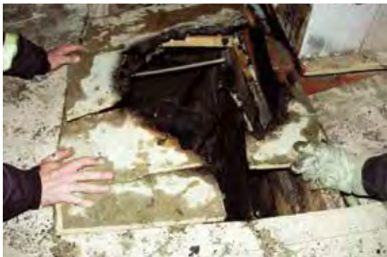
Felaktigt hanterad aska är en vanlig brandorsak. Här har golvet brunnit när aska från en kakelugn som det eldats i dagen före ställts i en plastpåse på golvet.

Bränder i bostäder är ofta eldstadsrelaterade. Därför är det viktigt att uppmärksamma säkerheten kring eldstäder. De boende behöver informeras om vad som gäller för de lokala eldstäder som finns i fastigheten, exempelvis kakelugnar och öppna spisar. Viktig information är om det får eldas i dessa, vad som i så fall får eldas, i vilken omfattning det får eldas och hur askan ska hanteras.